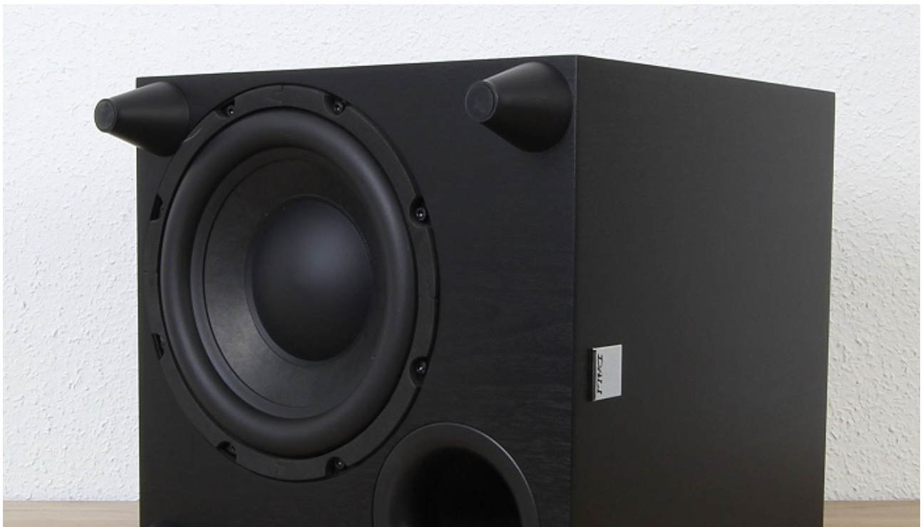
Beim Sub C-8D handelt es sich um einen Downfire-Woofer