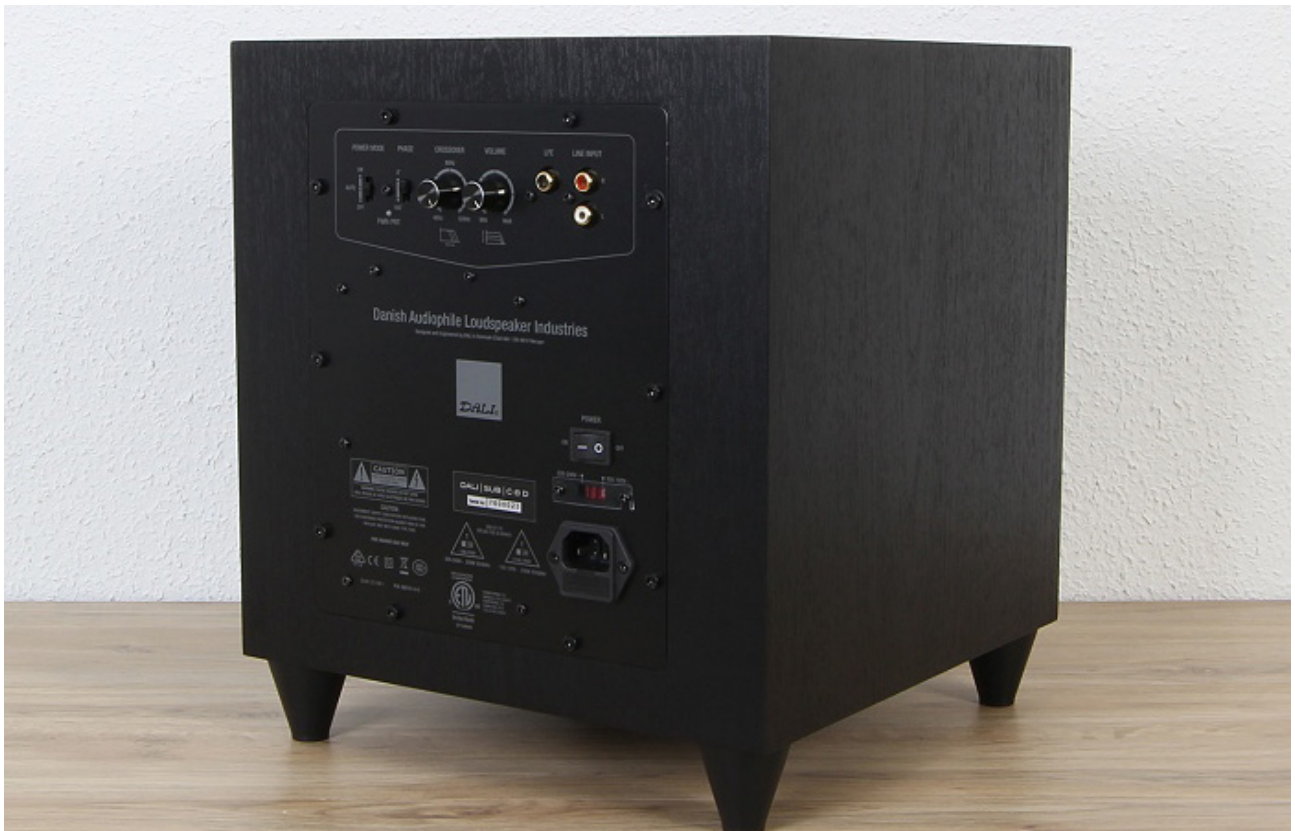
Rückseite des C-8D