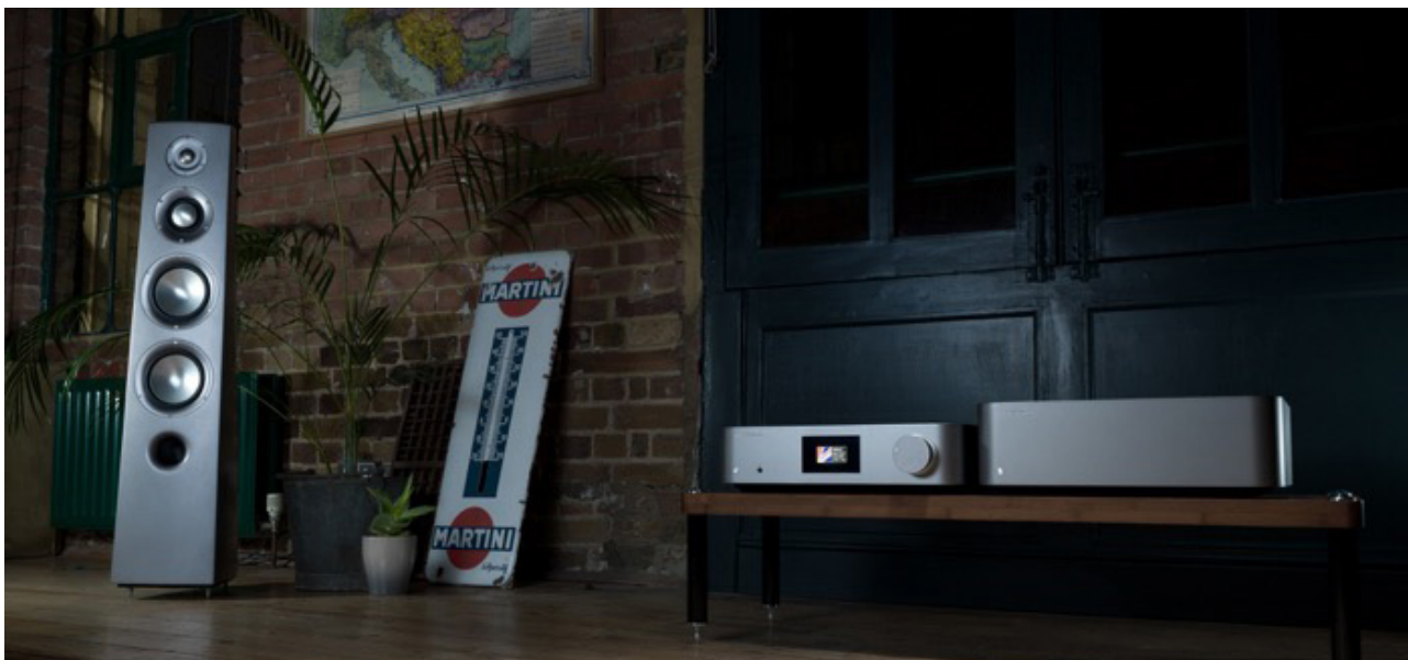
Optisch wirken die Komponenten sehr elegant