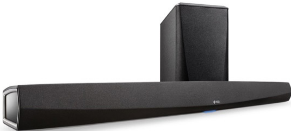
HEOS HomeCinema HS2

Auf der High End zeigt Denon auch das neueste Soundbar-Modell HEOS HomeCinema HS2 von Denon, dem Nachfolger des erfolgreichen TV-Soundsystems (Soundbar mit Wireless-Subwoofer) mit Musikstreaming- sowie Multiroom-Technologie an Bord.