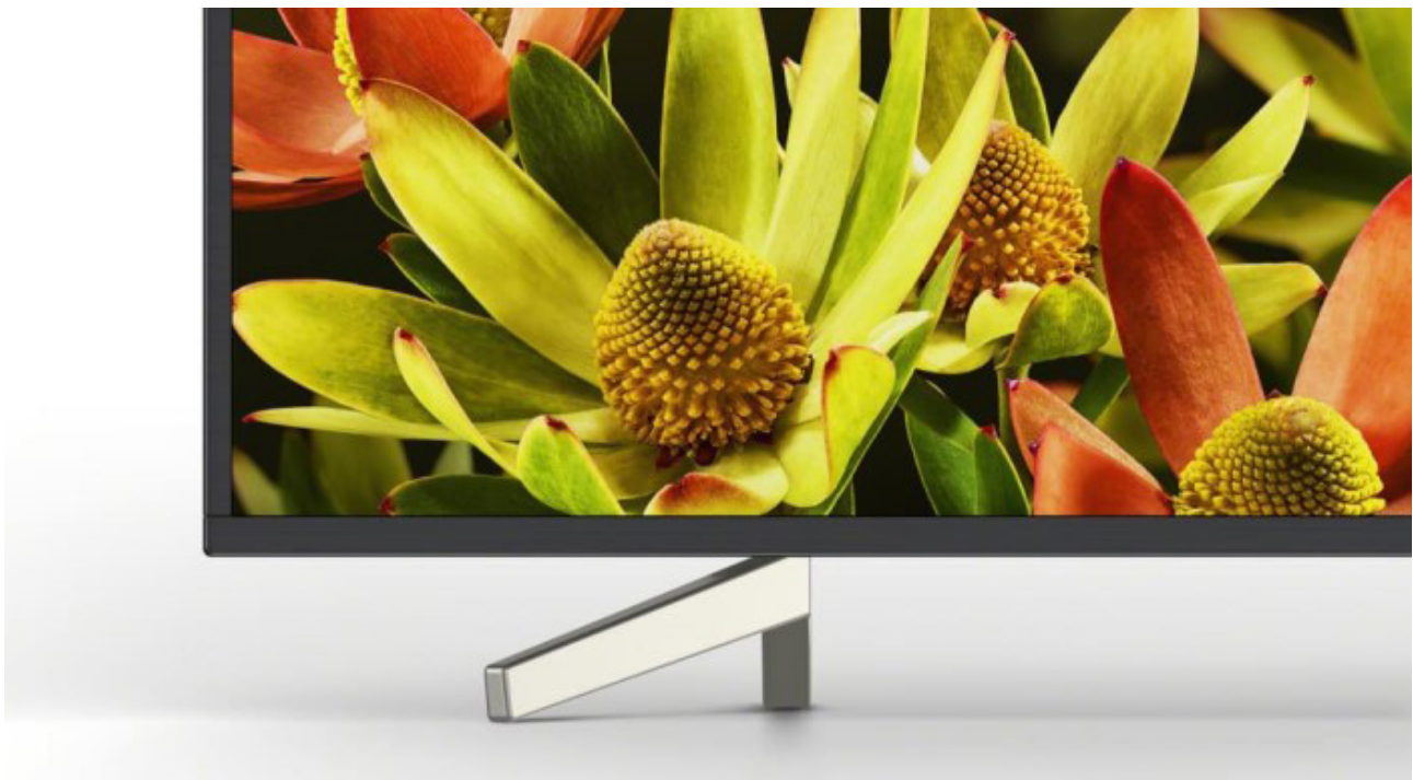
Standfuß des Sony XF83

Sony bereichert mit dem neuen Ultra HD-LCD-TV XF83 im 70 Zoll-Format den Markt. Der XF83 ist außer in dieser relativ großen Diagonale noch in 60 Zoll verfügbar und verfügt über den 4K HDR-Bildprozessor X1. Als Betriebssystem setzt Sony wie üblich Android ein. Der KD-70XF8305 kommt auf faire 2.499 EUR, das 60-Zoll-Modell KD-60XF8305 auf 1.499 EUR. Ab Juli, so die aktuelle Planung, kommen die Modelle in den Handel. Bislang zeichneten sich Sonys LCD-Neuheiten 2018 durch eine enorme visuelle Dynamik, einen guten Schwarzwert und ein komfortables Handling aus. Die sehr guten Bildprogramme Cinema pro und Cinema home werden voraussichtlich auch bei den XF83-Modellen wieder vorhanden sein.