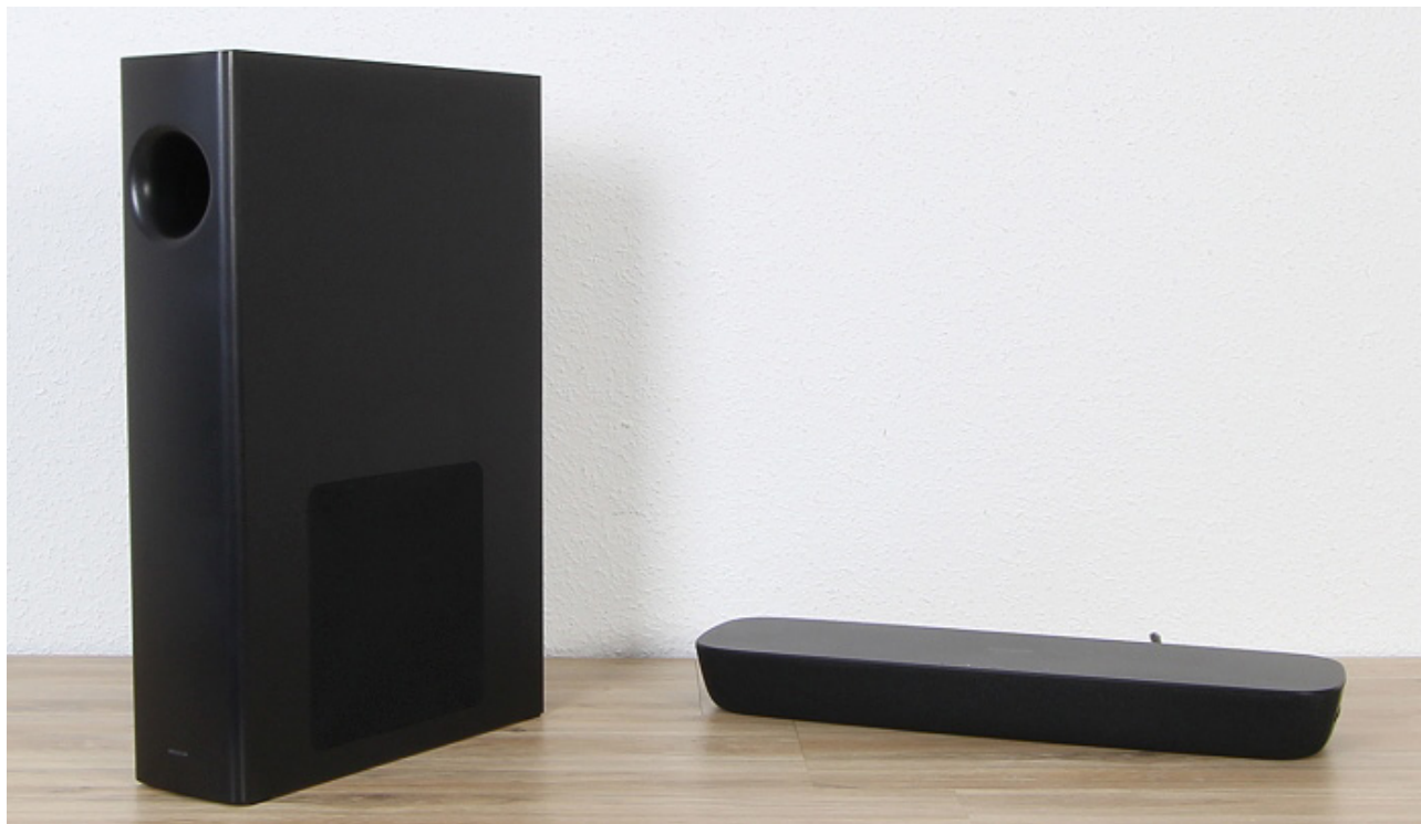
Günstig, aber leistungsfähig: Panasonic SC-HTB254

Panasonic gibt im Soundbar-Geschäft Gas: Nur 200 EUR kostet die SC-HTB254 mit extrem schlankem Wireless-Subwoofer und 120 Watt (RMS) Gesamt-Systemleistung. Bluetooth und HDMI sorgen für moderne Verbindungsmöglichkeiten, und wie wir feststellen konnten, klingt die Soundbar richtig kräftig und erwachsen. Dabei ist die Soundbar nur 45 cm breit, und somit einfach zu integrieren. Für eine gelungene akustische Anpassung sorgen verschiedene DSP-Betriebsarten.