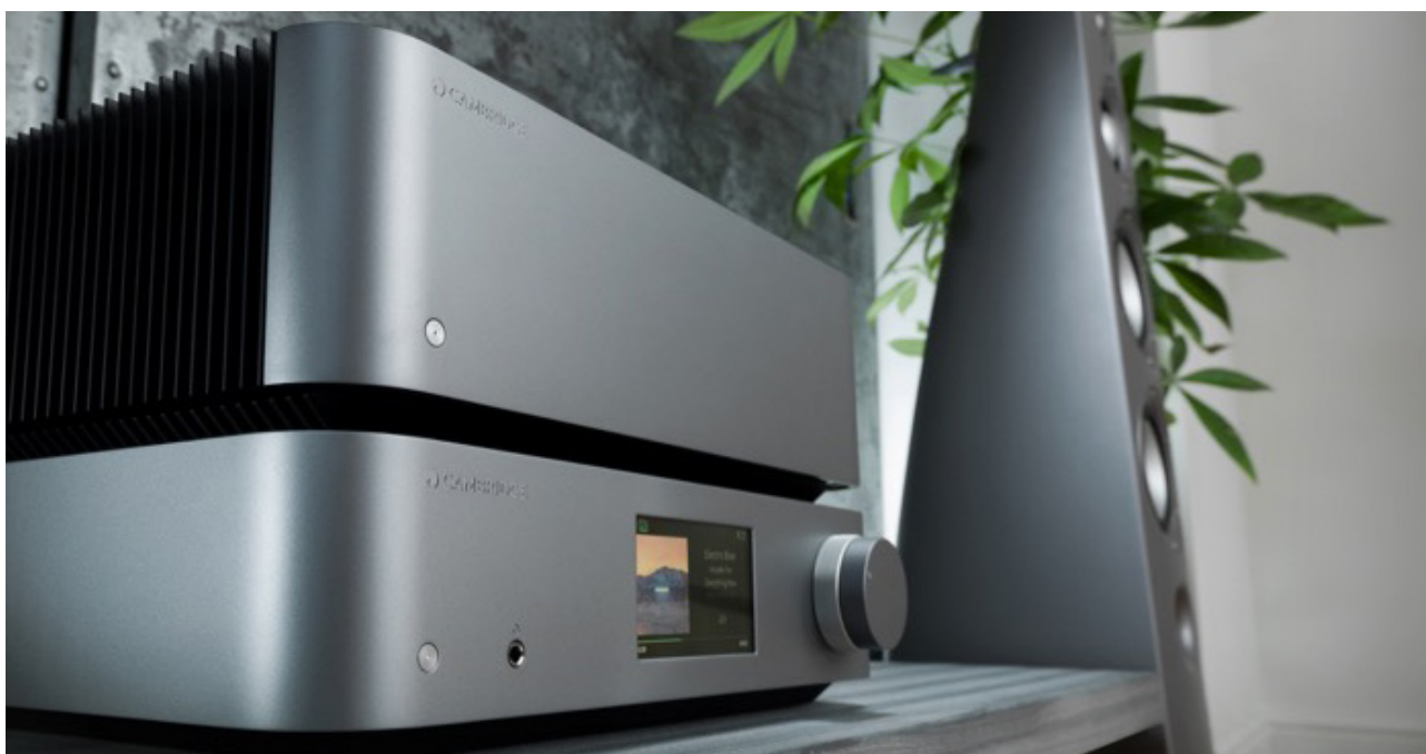
Vorverstärker und Endstufe

Die im extrem eleganten Design gehaltenen Komponenten kommen genau passend zum 50-jährigen Jubiläum des britischen Traditionshauses. Klar dürfte sein, dass überall nur beste Technik und ausgesuchte Bauteile zum Einsatz kommen. Cambridge-Technologien wie „StreamMagic“ und die Class XA-Verstärkertechnik wurden weiter optimiert und verfeinert. Weit überdurchschnittlich leistungsfähige Stromversorgungen ermöglichen bei Vollverstärker und Endstufe enorme maximale Pegel und höchste akustische Reinheit. Ein großes Display auf der Frontblende des Vorverstärkers mit Netzwerk-Player-Funktion erleichtert die Handhabung.