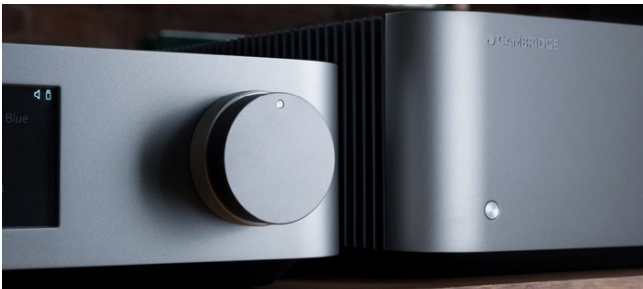
Cambridge Audio präsentiert neue Referenz-Serie