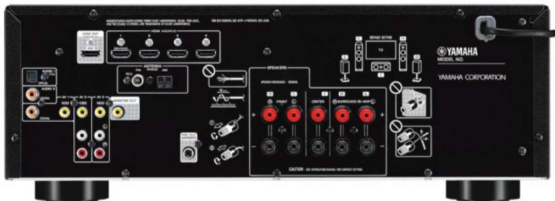
Rückseite des neuen Einstiegs-Receivers

Yamaha stellt im Einstiegssegment der AV-Receiver eine Neuheit vor: Es handelt sich um den RX-V385, einem in schwarzer oder titanfarbener Variante lieferbarem 5.1-AV-Receiver mit Bluetooth. MusicCast ist bei diesem 369 EUR kostenden Modell nicht vorhanden, dafür aber ein „Direct Modus“ für den kürzestmöglichen Signalweg. Ab Mai wird der 5.1-AV-Receiver mit YPAO Lautsprecher-einmesssystem, 4K-tauglichen HDMI-Terminals mit HDCP 2.2 und mit neuen 384 kHz/32-Bit D/A-Wandlern ausgeliefert.