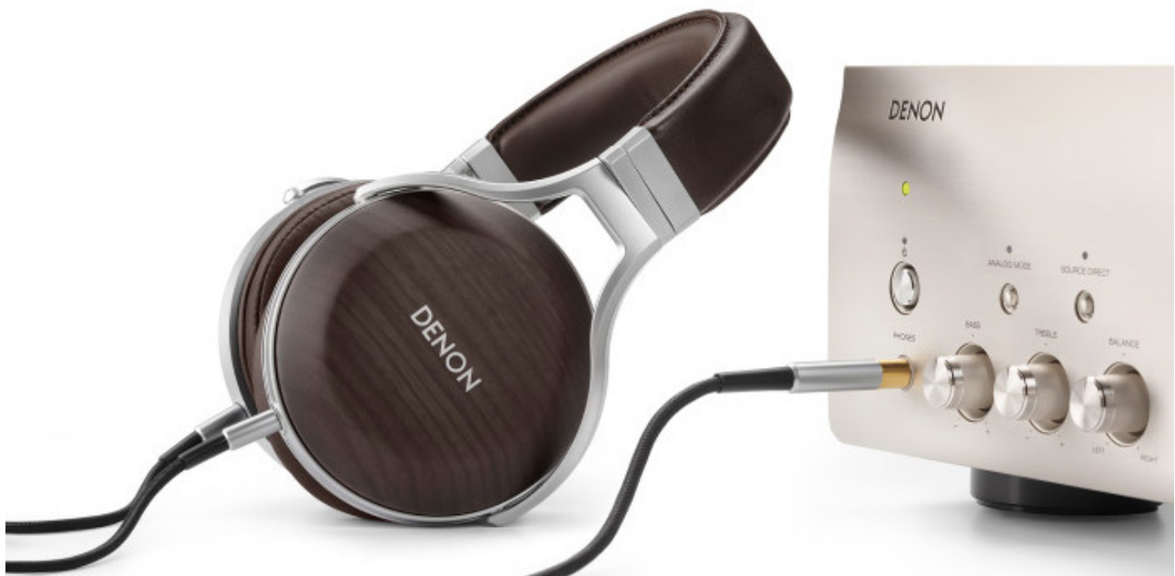
Neuer Kopfhörer: Denon AH-D5200

Bei Denon finden wir den neuen Premium-Kopfhörer AH-D5200, der für 599 EUR in den Handel kommt. Kennzeichen ist das spezielle Holz-Design außen an den Ohrmuscheln. Als Material für die Schalen kommt Zebraholz zum Einsatz, laut Hersteller ist das Material mit verantwortlich für den angenehmen, vollen Klang. Auch einer hervorragenden Akustik Rechnung trägt die Denon-eigene, in Japan entwickelte 50 mm FreeEdge-Treibermembran.