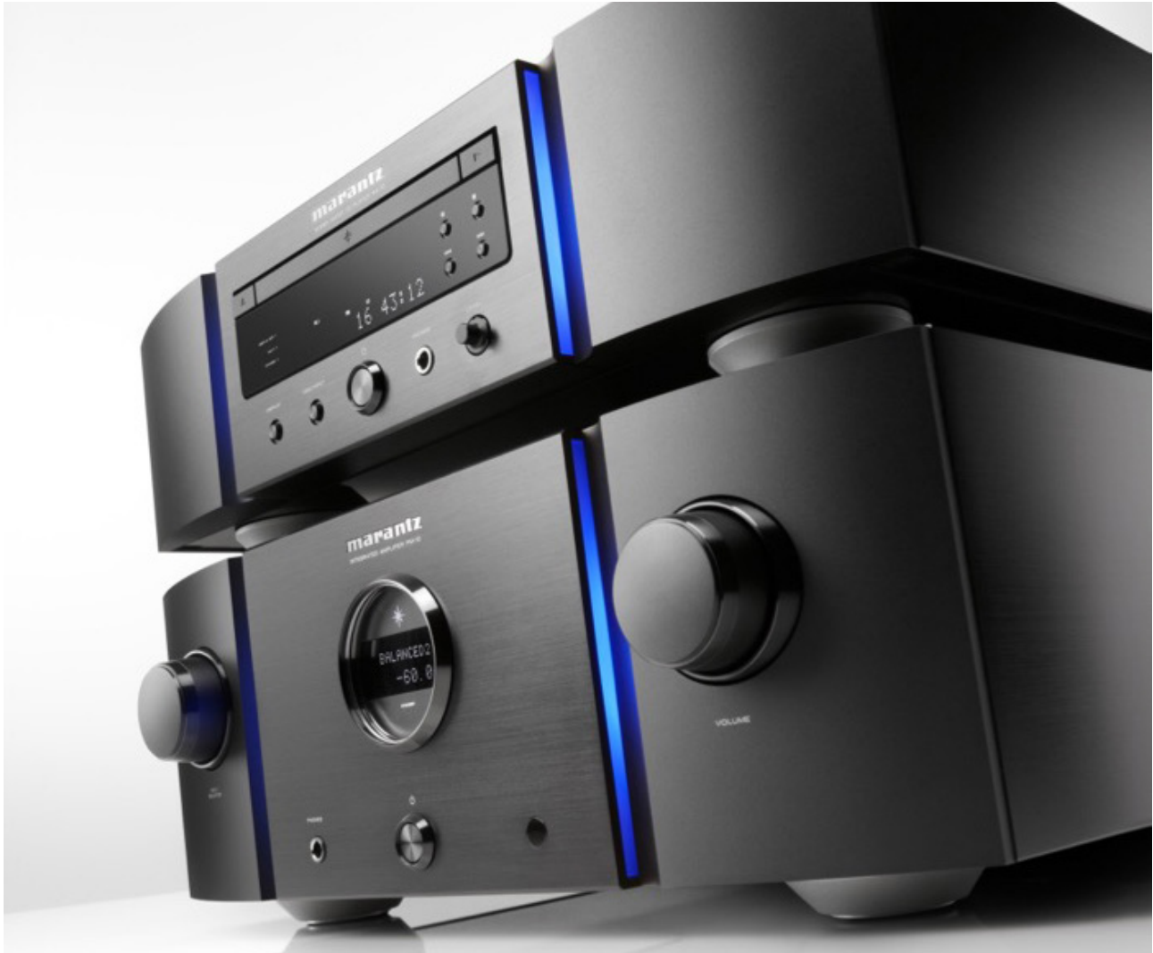
Aktuelle Topmodelle von Marantz - PM10 und SA10