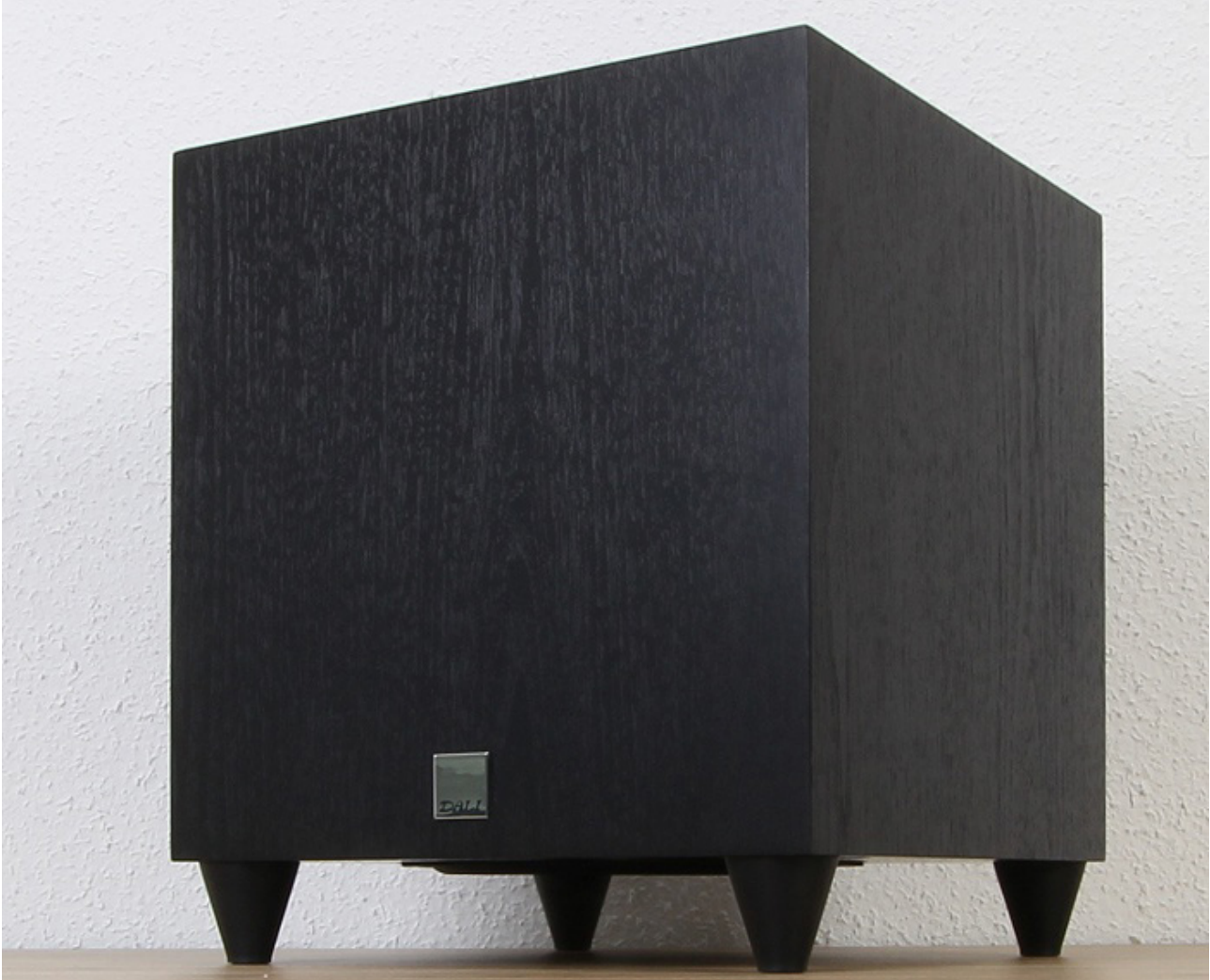
Dali Sub C-8D

Die dänischen Lautsprecher-Experten von Dali ermöglichen mit dem neuen aktiven Subwoofer SUB C-8D einen mit 399 EUR (UVP) kostengünstigen Einstieg ins Produkt-Portfolio. Der kompakte Bass-reflex-Downfire-Subwoofer ist mit einer kräftigen Endstufe ausgestattet, die 170 Watt Dauerleistung und 220 Watt kurzzeitige maximale Leistung aufweisen kann. Der Basstreiber misst 20,32 cm, Frequenzen von 31 Hz bis 180 Hz (bei +/- 3dB) werden dargestellt. Maximal sind 109 dB Schalldruck drin.