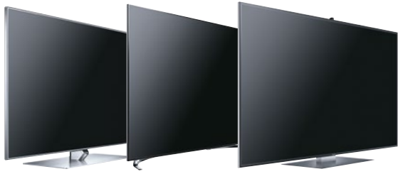
Samsung LED TV UE46F7090 (46"/117 cm) Samsung LED TV UE55F8090 (55"/139 cm) Samsung UHD TV UE65F9090 (65"/164 cm)

Samsung Premium Smart TV kaufen, Samsung GALAXY Tab gratis dazu erhalten. 1