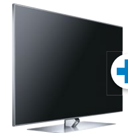
Samsung LED TV UE46F7090 (46"/117 cm)

Stiftung Warentest, gut (1,8), Ausgabe 08/2013, zum UE46F7090, im Test: 10 TV-Geräte, 4x gut, 6x befriedigend.