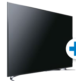
Samsung LED TV UE55F8090 (55"/139 cm)

Stiftung Warentest, gut (1,8), Ausgabe 08/2013, zum UE55F8090, im Test: 3 TV-Geräte, 3x gut.