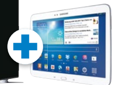
Samsung GALAXY Tab 3 10.1 Wi-Fi (16 GB)