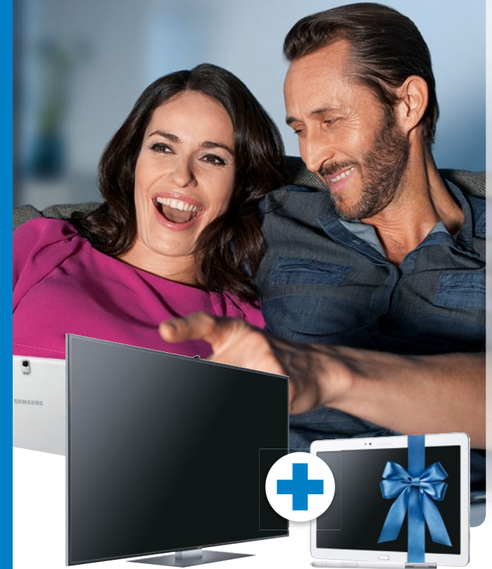
Samsung UHD TV UE65F9090 (65"/164 cm)