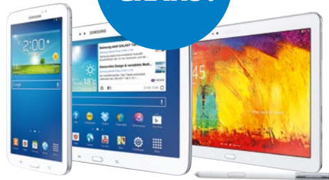
Samsung GALAXY Tab 3 7,0 Wi-Fi (8 GB) Samsung GALAXY Tab 3 10.1 Wi-Fi (16 GB) Samsung GALAXY Note 10.1 2014 Edition Wi-Fi (16 GB)