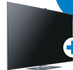
Samsung UHD TV UE65F9090 (65"/164 cm)

Heimkino, überragend (1,1), Ausgabe 10_11/2013, zum UE65F9090, Einzeltest.