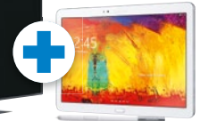
Samsung GALAXY Note 10.1 2014 Edition Wi-Fi (16 GB)