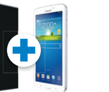
Samsung GALAXY Tab 3 7.0 Wi-Fi (8 GB)