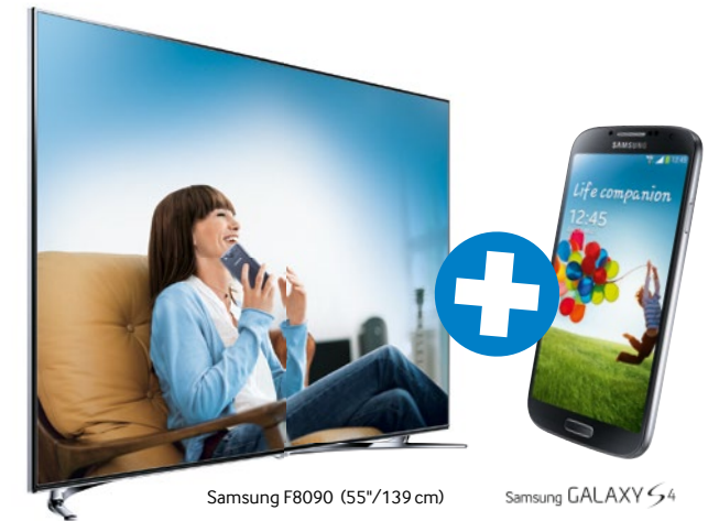
Samsung F8090 (55"/139 cm)

1 Premium Smart TV kaufen. 1 GALAXY S4 oder S3 gratis bekommen.*