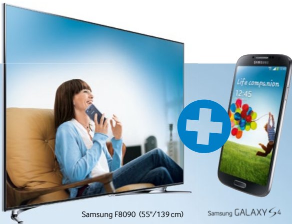
Samsung F8090 (55"/139 cm)

1 Premium Smart TV kaufen. 1 GALAXY S4 oder S3 gratis bekommen.