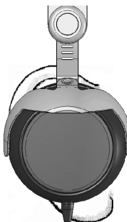
Kopfhörer sitzt korrekt