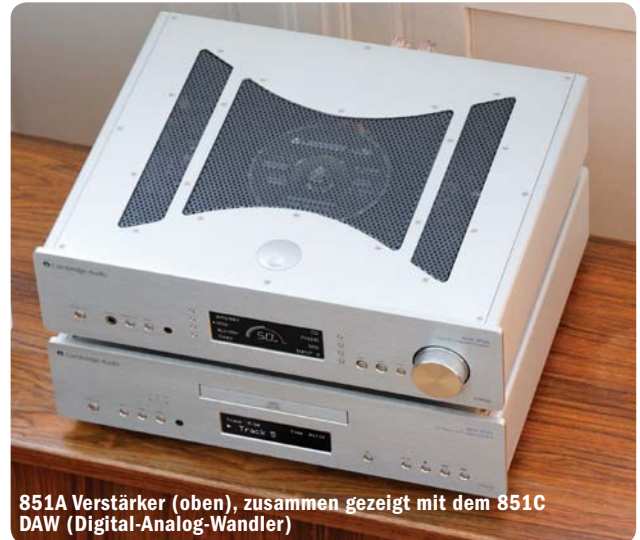
851A Verstärker (oben), zusammen gezeigt mit dem 851C DAW (Digital-Analog-Wandler)