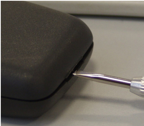
Abb. 2: Öffnen des Speed Light

Bei der blauen LED handelt es sich nicht um eine Laserdiode! Blicken Sie bitte trotzdem nicht längere Zeit direkt in den Lichtstrahl, da dieser eine hohe Leuchtkraft besitzt.