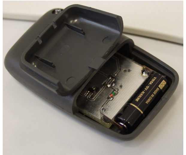
Pic. 3: Polarität der Batterien