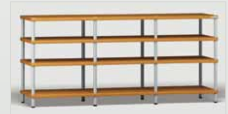
Trend 3 kirsch