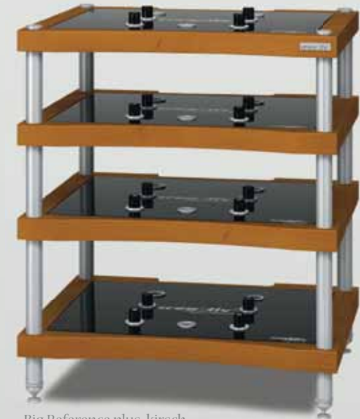
Big Reference plus kirsch