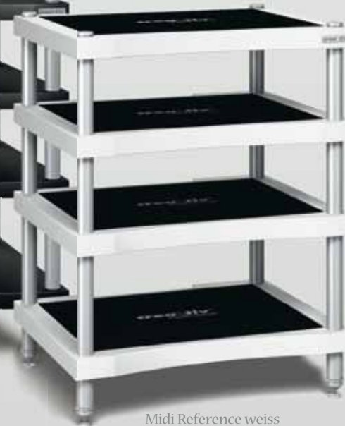
Midi Reference weiss