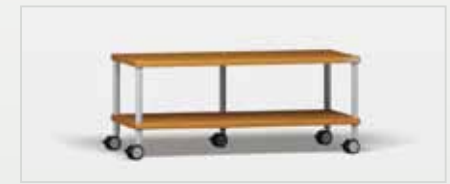
Trend TV kirsch