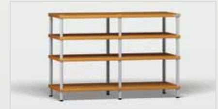
Trend 2 kirsch