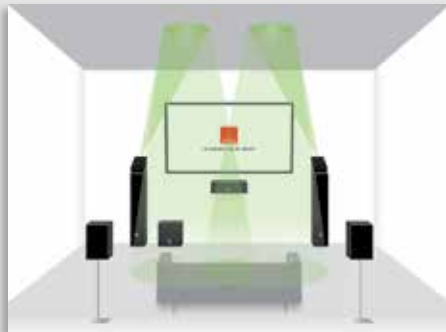
DALI ALTECO C-1 auf den Frontboxen eines 5.1.2-Systems als nach oben abstrahlender Lautsprecher für die Höhenkanäle

Der DALI ALTECO C-1 lässt sich auch als Wandlautsprecher in Stereoanlagen oder als Nahfeld-Monitor auf dem Schreibtisch verwenden. Wird der Lautsprecher auf zwei Drittel Höhe an der Wand vor dem Hörplatz montiert, strahlt er dank seiner abgeschrägten Schall-