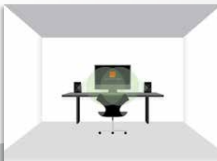
DALI ALTECO C-1 als Nahfeld-Monitore auf einem Schreibtisch