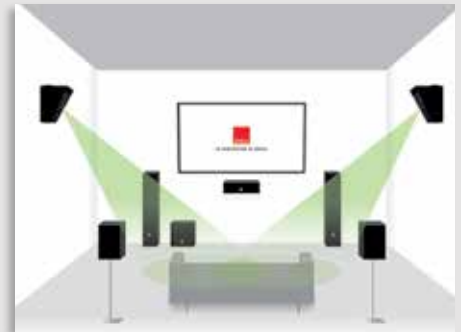
DALI ALTECO C-1 als seitliche Surround-Lautsprecher eines 7.1-Heimkinosystems