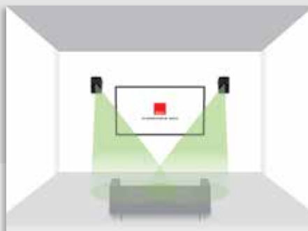
DALI ALTECO C-1 als Stereolautsprecher oben an der Wand vor dem Hörplatz