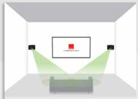
DALI ALTECO C-1 als Stereolautsprecher horizontal an der Wand vor der Hörposition