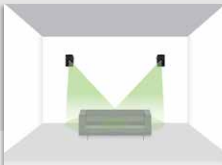
DALI ALTECO C-1 als rückwärtige Surround-Lautsprecher eines 5.1-Systems