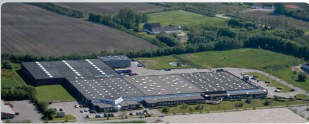
Das DALI-Firmengebäude in Dänemark

Seit 1983 gestaltet, entwickelt und produziert DALI (Danish Audiophile Loudspeaker Industries) Lautsprecher für höchste Ansprüche.