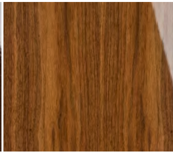
Walnuss Furnier Hochglanz