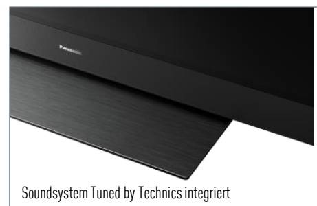
Soundsystem Tuned by Technics integriert