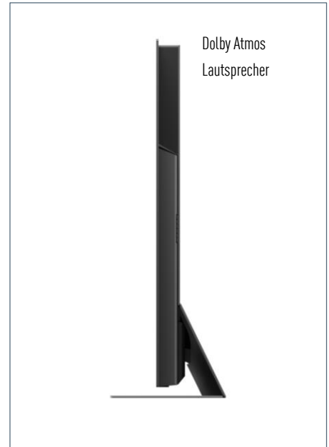
Dolby Atmos Lautsprecher

TX-55GZW2004 | 55" – 139 cm | EAN 5025232892495