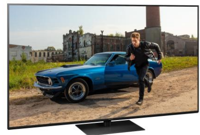
75" Variante mit elegantem Metallstandfuß*