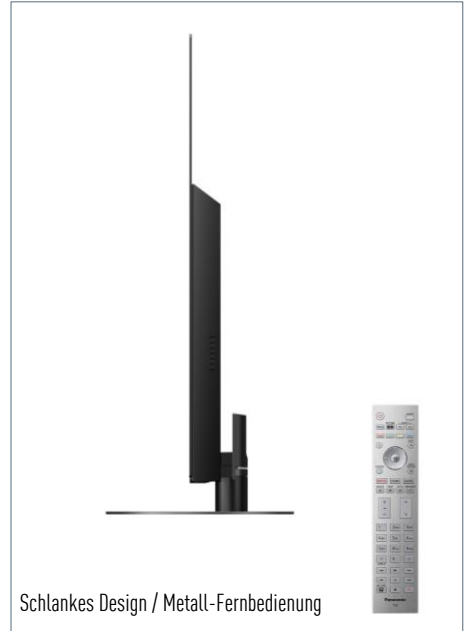
Schlankes Design / Metall-Fernbedienung

Neue Möglichkeiten des Fernsehens – Unterstützung von TV>IP, zahlreicher Apps und des HbbTV Operator App Standards