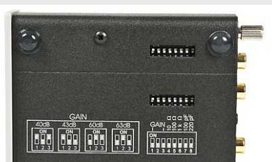
Phono Box S Schalter am Geräteboden >