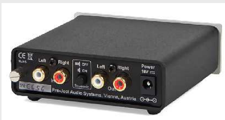
< Rückansicht Phono Box S

Die Phono Box S bietet natürliche Dynamik und Transparenz, analoge Wärme mit hoher Detailtreue sowie ein Höchstmaß an Klangreinheit bei allen Frequenzen. >>> Ein audiophiles Schnäppchen! <<<